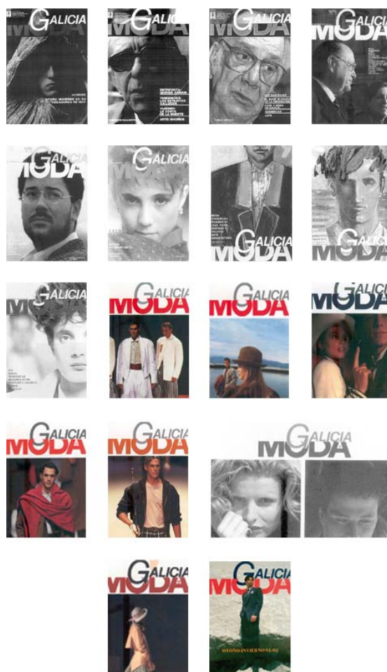
Fig. nº 3: Portadas revista Galicia Moda